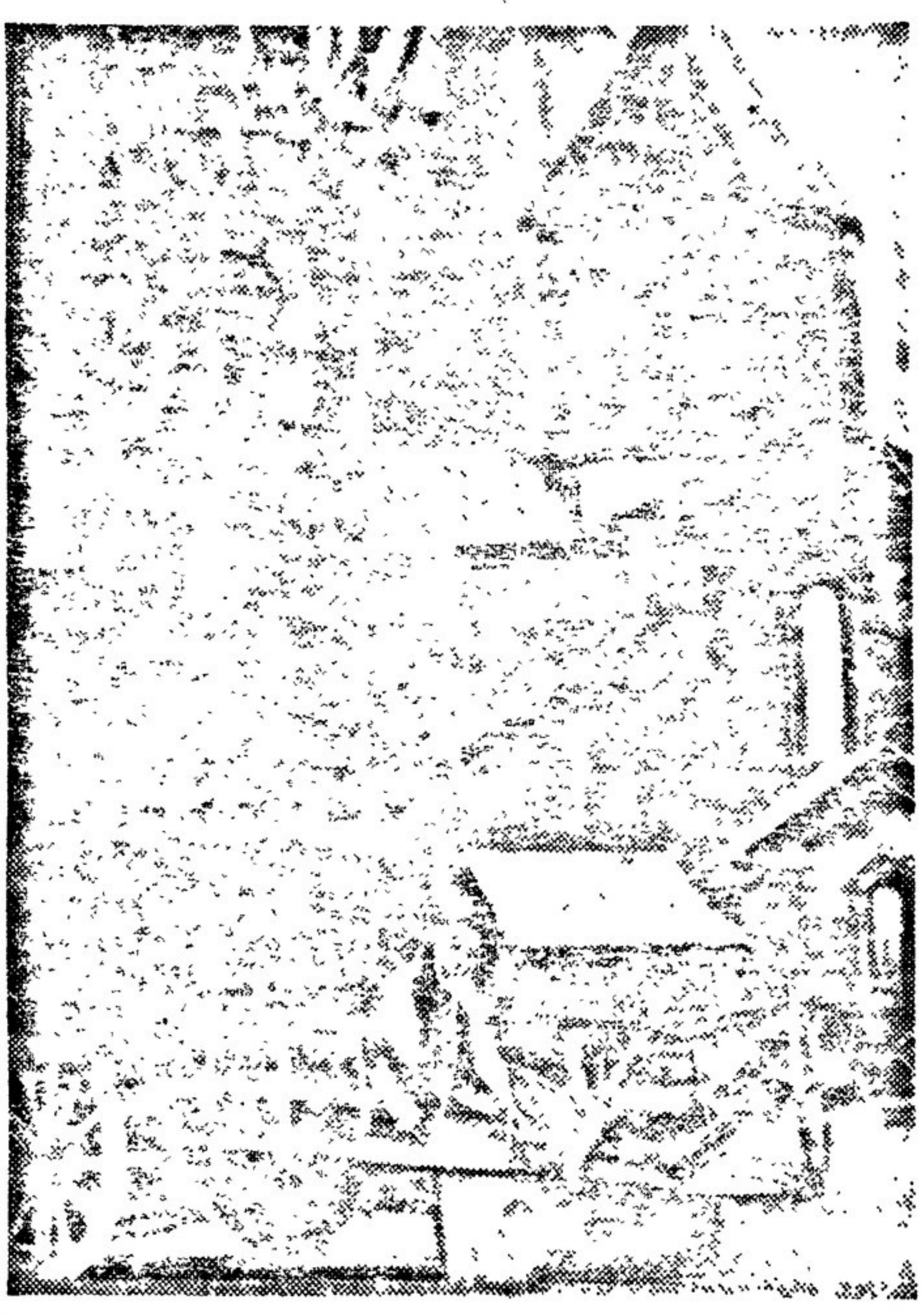
«Опера «Данси» (Панк) в Государственном Тбилиском театре оперы и балета.

Построенная на мелодиках грузинской народной песни опера Д. Ар-