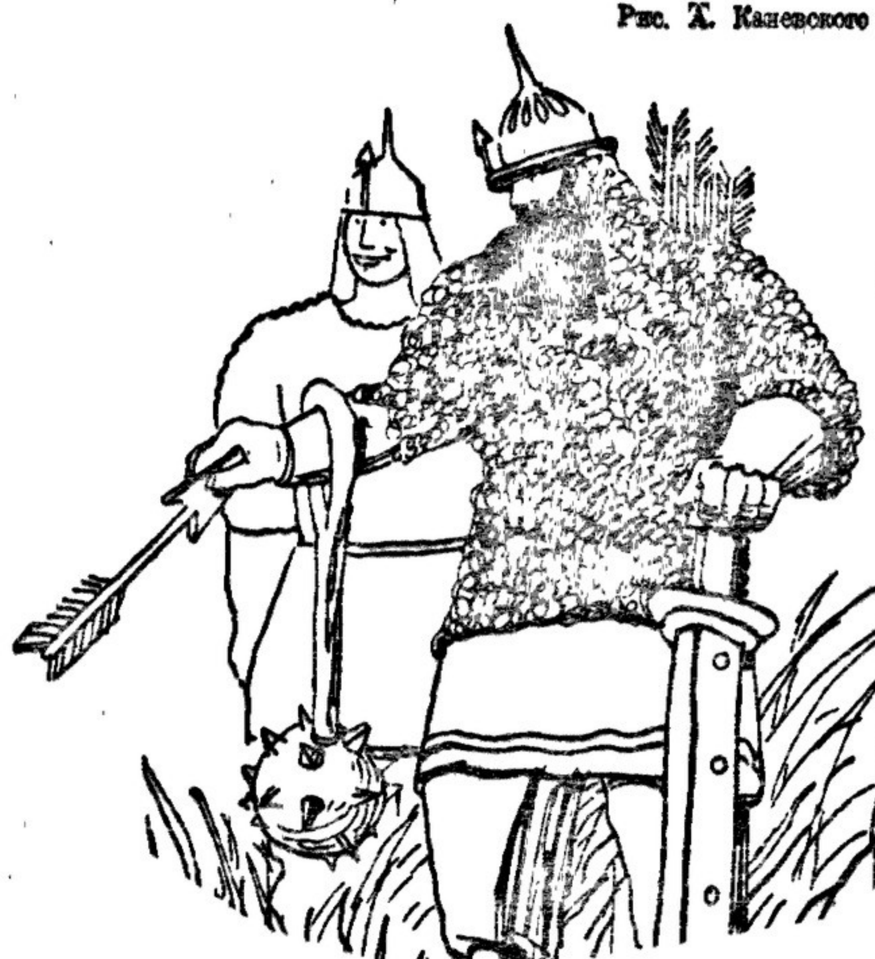
Рис. А. Каневского